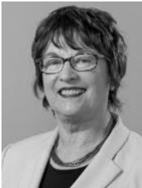
Brigitte Zypries Beiratsvorsitzende Ex-Bundesministerin für Wirtschaft und Energie, davor lang- jährige Bundesjustiz- ministerin

Der Beirat unterstützt die unabhängige Arbeit und die strategische Weiterentwicklung des DISQ.