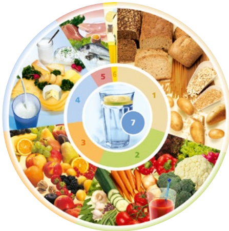
DGE-Ernährungskreis*, Copyright: Deutsche Gesellschaft für Ernährung e. V., Bonn

Die Deutsche Gesellschaft für Ernährung (DGE) hat einen Ernährungskreis entwickelt, der als Richtlinie für die Zusammenstellung einer ausgewogenen Ernährung dient: